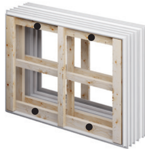
Poziția recomandată a punctelor externe de fixare.

Când scoateți cofrajul, asigurați-vă că rama ferestrei nu este afectată de suportul de protecție al cofrajului.